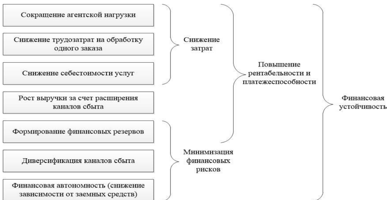
Рисунок 1 – Экономические эффекты на микроуровне

В масштабе отдельных предприятий туристско- рекреационной сферы, зачастую не обладающих свободными ресурсами для оптимизации деятельности, возможность использования регионального портала для продвижения своих услуг может стать серьезной финансовой опорой. Однако, несмотря на всю продемонстрированную выгодность системы, конечный результат интеграции для каждого конкретного предприятия будет зависеть от определенных факторов. В первую очередь, это поставляемый туристский продукт. Оптимальный набор характеристик, определяющих успешность электронной реализации того или иного продукта туристского региона наглядно продемонстрирован на рисунке 2.