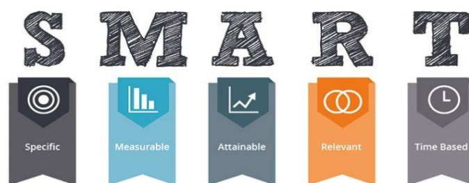
1.1 - сурет SMART аббревиатурасы

SMART технологиясы - жүзеге асатын мақсаттарды қалыптастыру үшін заманауи тәсіл. Smart ағылшын тілінен аударғанда «ақылды» деген мағынаны білдіреді. Яғни, ақылды технология, ақылды техника, пайдалануға ыңғайлы, мейлінше ықшам, көп функциялы құрылғыларды айтуға болады. SMART - мақсат бойынша басқарудың белгілі әдісі.