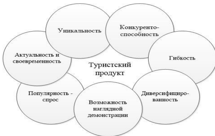
Рисунок 2 – Внутренние факторы, обуславливающие эффективность реализации туристского продукта

В масштабе отдельных предприятий туристско- рекреационной сферы, зачастую не обладающих свободными ресурсами для оптимизации деятельности, возможность использования регионального портала для продвижения своих услуг может стать серьезной финансовой опорой. Однако, несмотря на всю продемонстрированную выгодность системы, конечный результат интеграции для каждого конкретного предприятия будет зависеть от определенных факторов. В первую очередь, это поставляемый туристский продукт. Оптимальный набор характеристик, определяющих успешность электронной реализации того или иного продукта туристского региона наглядно продемонстрирован на рисунке 2.