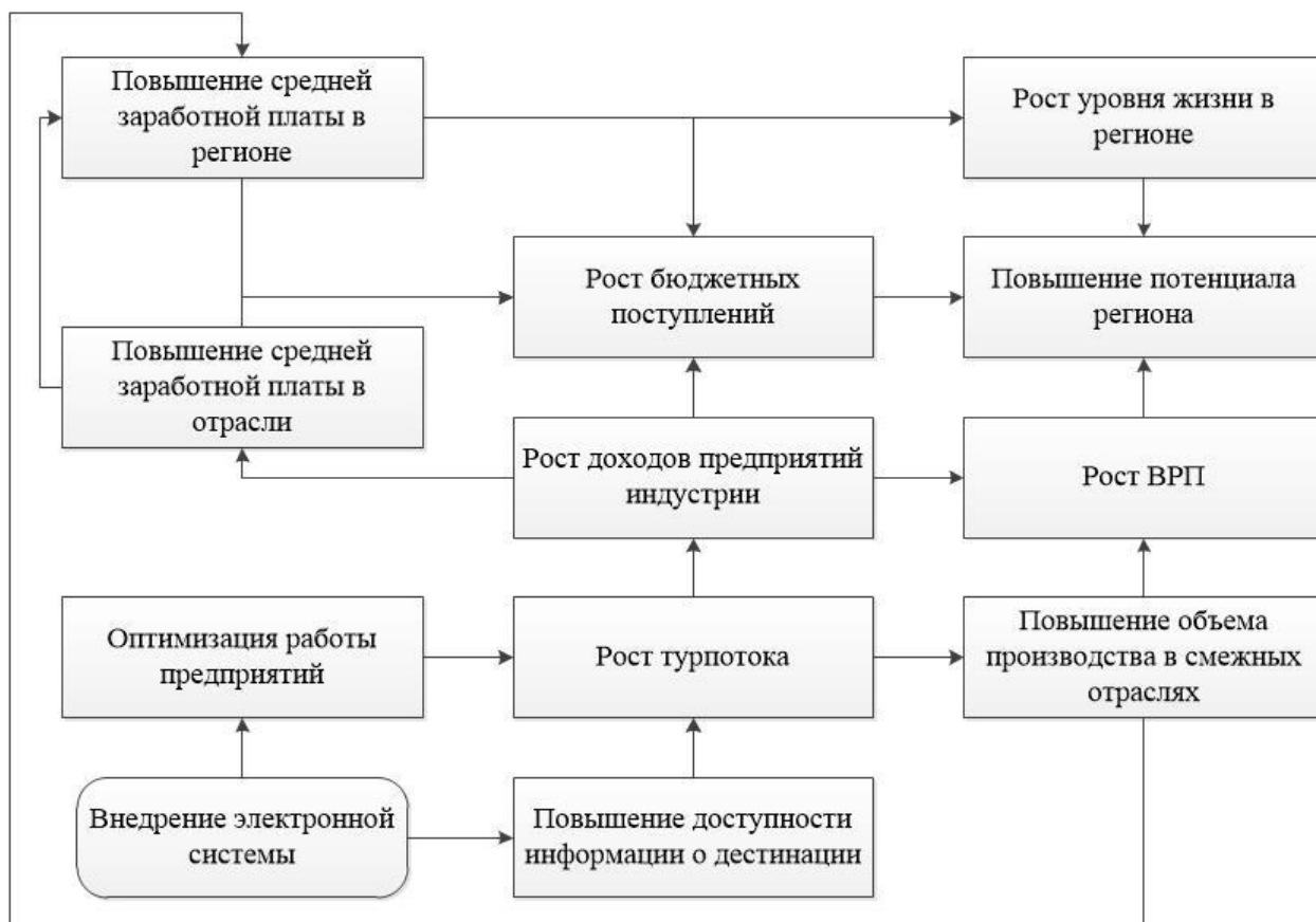
Рисунок 3 – Макроэкономические эффекты электронной коммерции в туризме

Образование макроэкономического эффекта происходит под совокупным воздействием ряда взаимодополняющих и перекрывающих факторов. Для оптимальной оценки ситуации следует наиболее весомые факторы разделить на две группы: нейтрализующие и усиливающие макроэкономический эффект. При этом однонаправленные (усиливающие) факторы нельзя назвать стимулирующими, так как они могут привести к возникновению ложного эффекта – эффекта, вызванного не деятельностью электронной коммерции, а прочими инструментами. Среди нейтрализующих факторов наиболее значимыми являются: снижение производительности по прочим значимым отраслям экономики, колебания курса национальной валюты и снижение экспортных поступлений, а также природные и прочие катаклизмы.