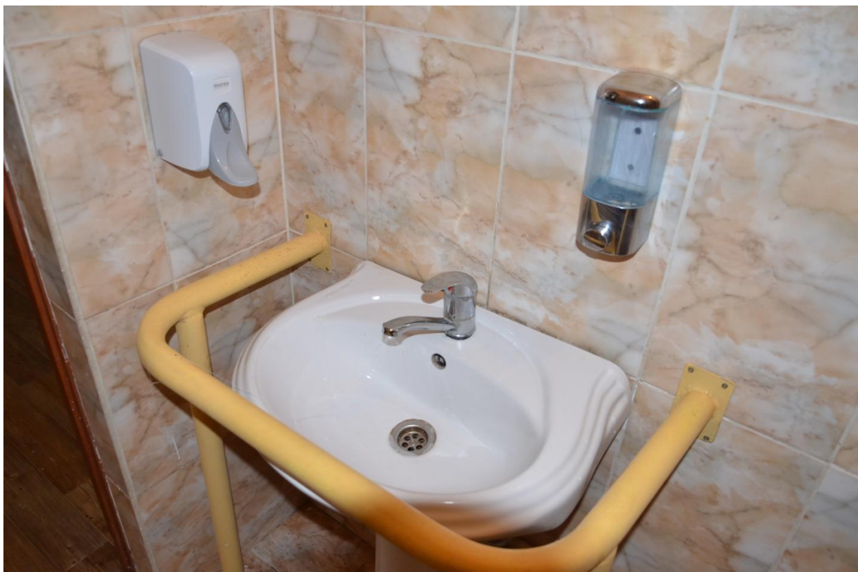
Сабын диспенсері. / Дозатор для мыла.