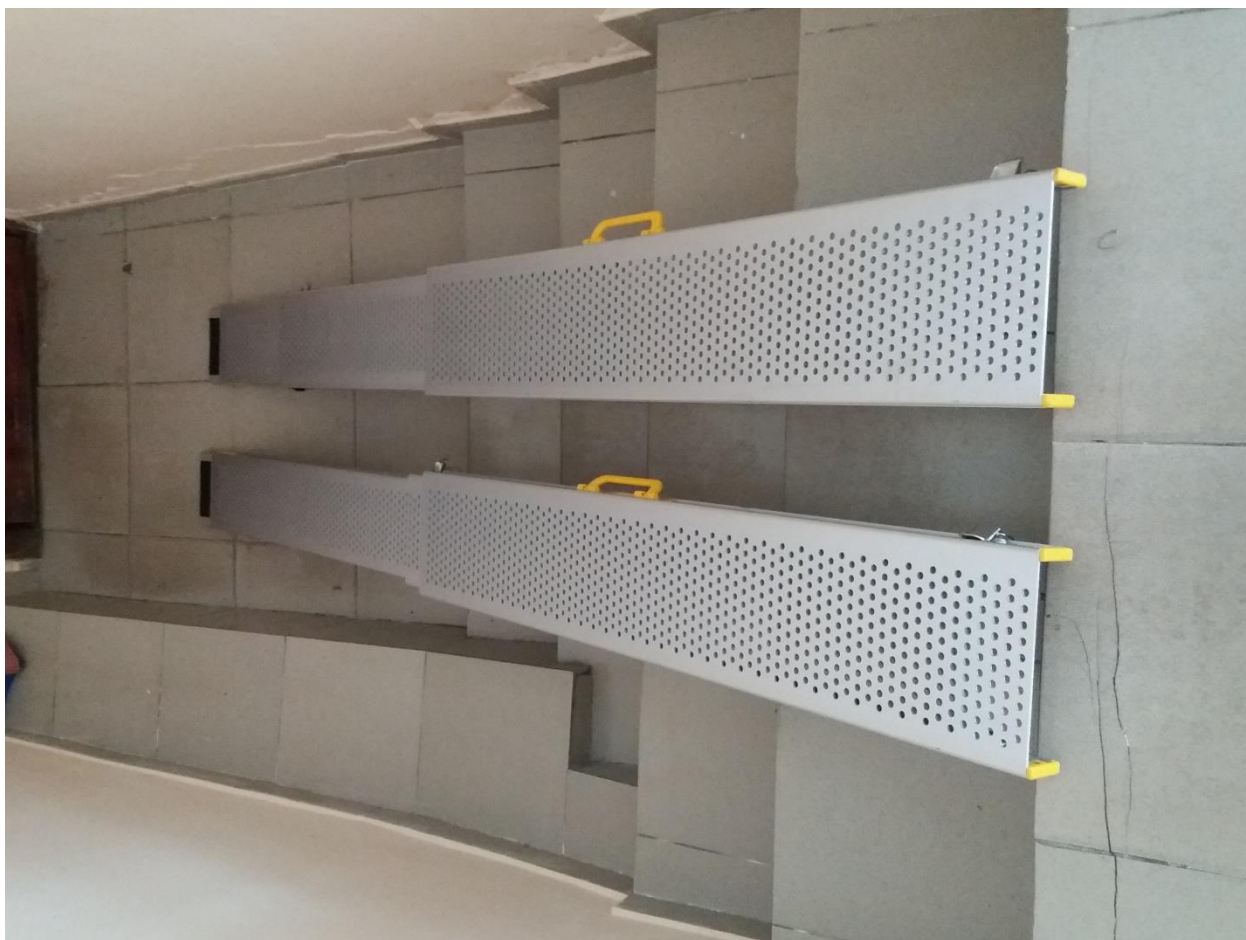
Алюминийден жасалған үш секциялы телескопиялық пандус. / Пандус алюминиевый телескопический трехсекционный.