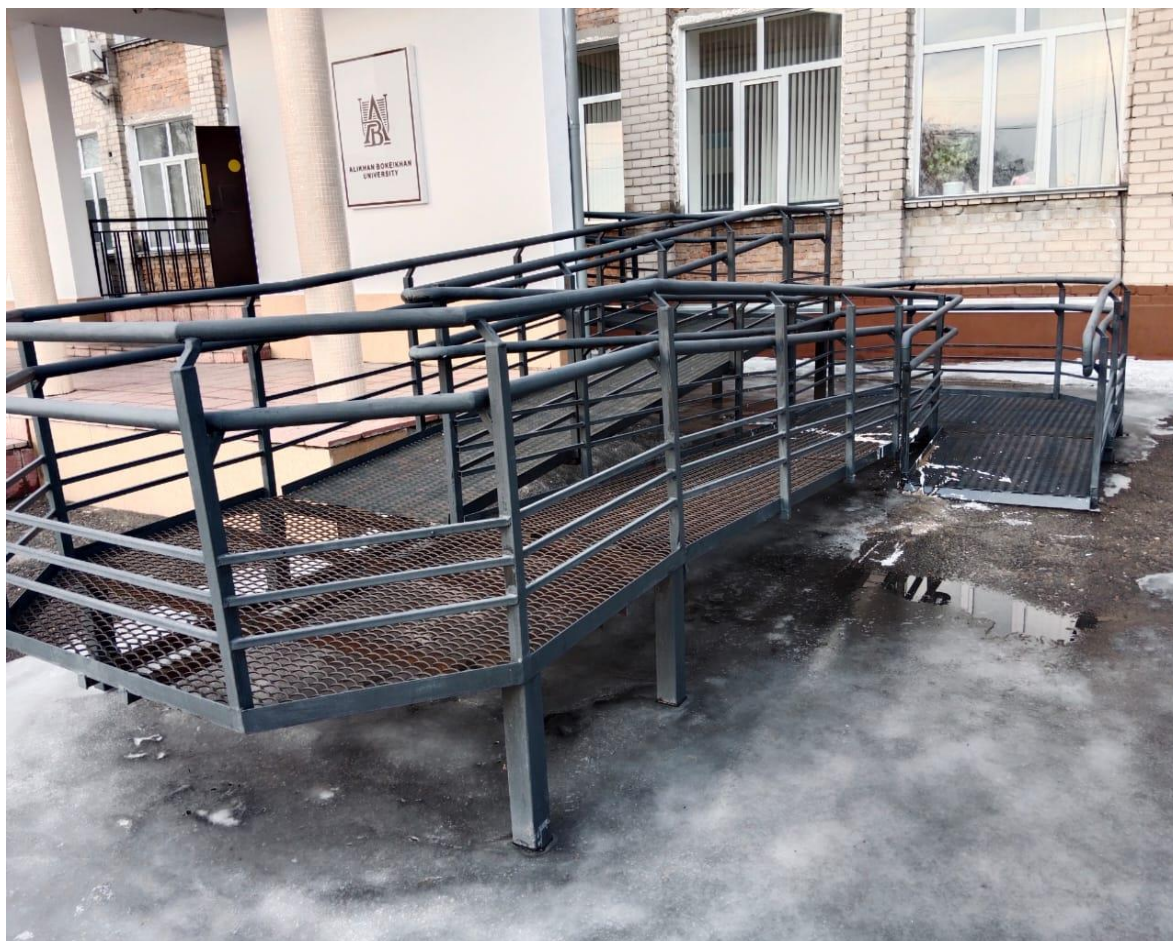
Стационарлық пандус. / Пандус стационарный.