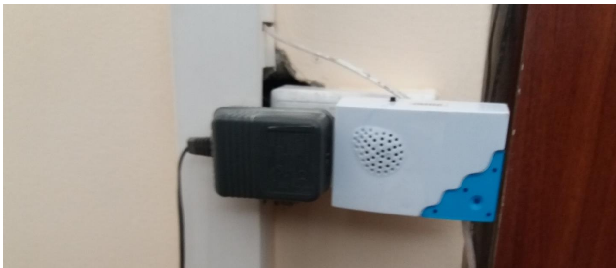
Қабылдағыш (құлақтандыру жүйесі). / Приёмник (система оповещения).

Тактильная таблица - график работы учреждения (шрифт Брайля). Кнопка вызова персонала, знак доступности объекта, указатели путей движения (круги на двери, противоскользящие ленты, тактильные пиктограммы).