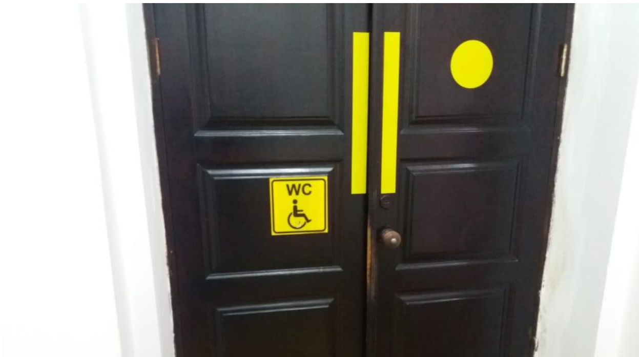
Қолжетімділік белгісі. / Знак доступности.