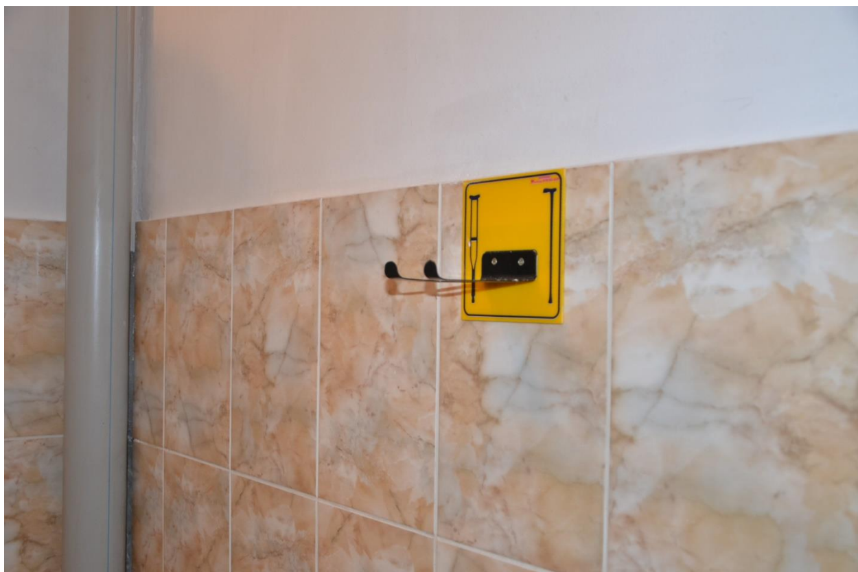
Балдақтарға арналған ілгіштер. / Крючки для костылей.