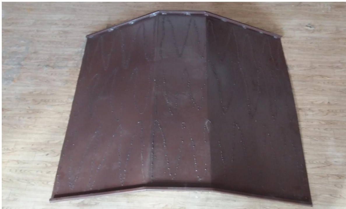
Алюминийден жасалған тасымалданатын пандус. / Пандус перекатной алюминиевый.