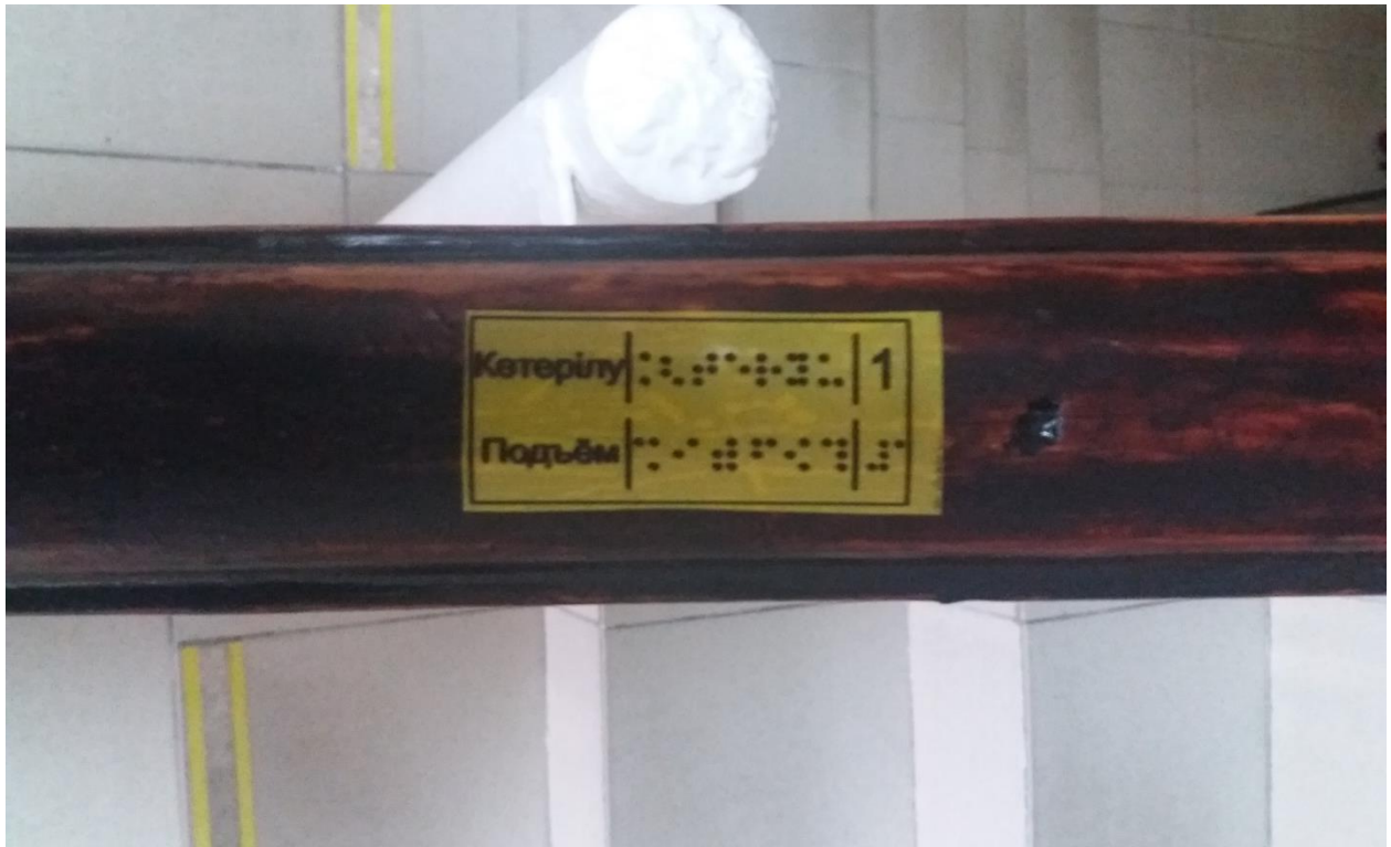
Көтеру/түсіру және қабаттын көрсете отырып баспалдақтарының таяныштарға қосылатын тактильды жапсырмалар (Брайл шрифті). / Тактильные наклейки на перила лестниц с указанием подъема/спуска и этажа (шрифт Брайля).