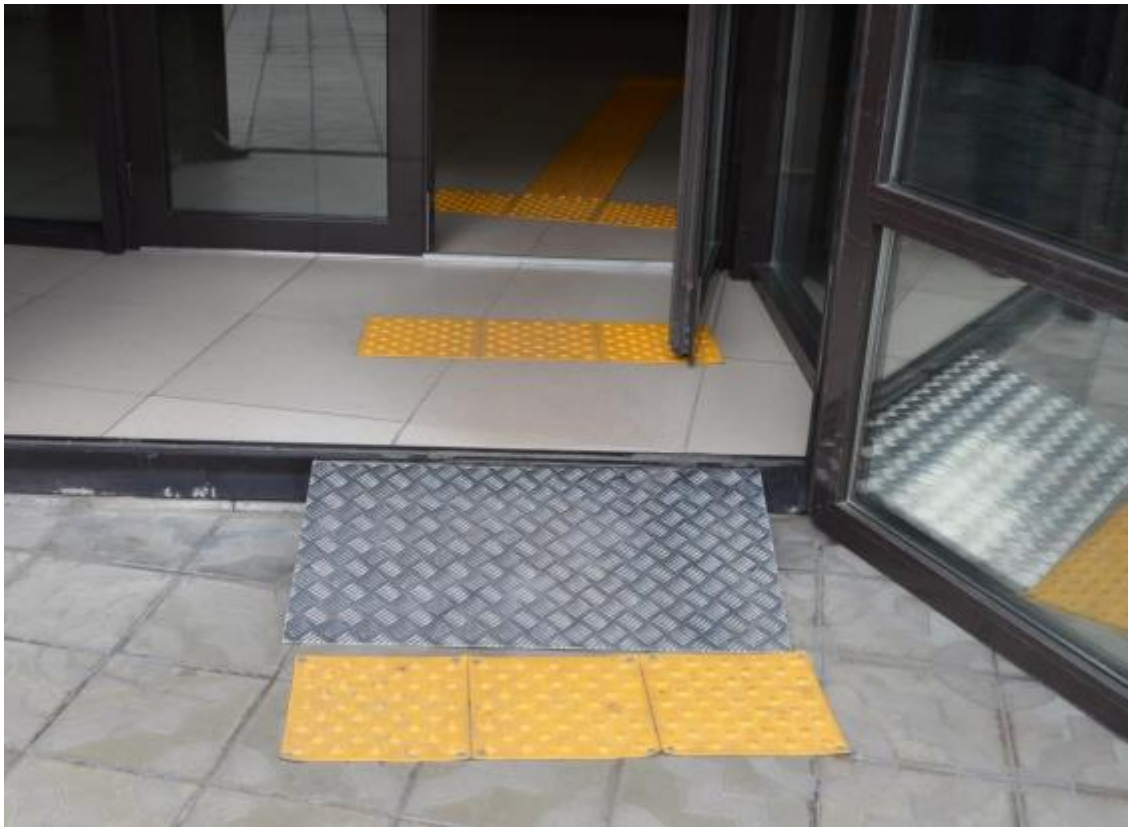
Алюминийден жасалган тасымалды пандус. / Пандус перекатной алюминиевый.