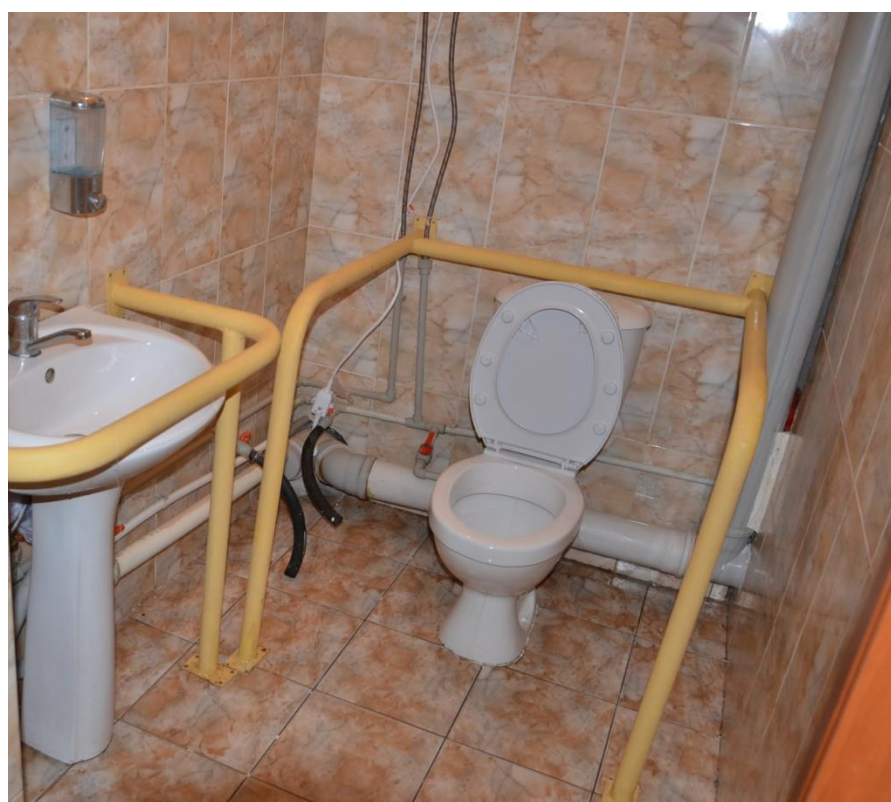
Унитазға жәнe қол жуғышқа арналған тұтқалар. / Поручни для умывальника и унитаза.