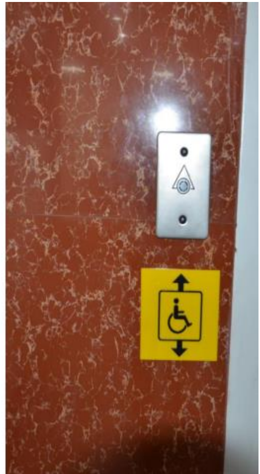
Жеделсатының қолжетімділік белгісі, қабаты көрсетілген тактильді жапсырмалар. / Знак доступности лифта, тактильные наклейки с указанием номеров этажей.