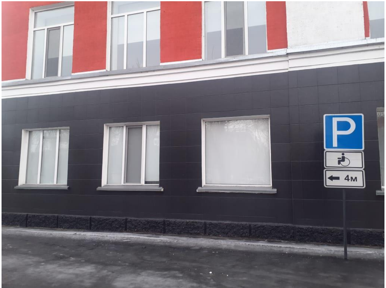
ХҚАТ үшін автотұрақтар. / Автостоянки для МГН.