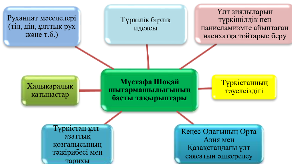
Кесте 2 - Мұстафа Шоқай шығармашылығының басты тақырыптары

Шоқай шығармаларының тақырыптық жүйелегенде тарихилық қағидасы басшылыққа алынды. Кеңестік кезеңде қазақ тарихының мұғажырлық тарихнамасы мүлдем зерттелмеді. Партиялық-мемлекеттік идеология бұндай тақырыпта зерттеу жүргізуге қатаң тиым салды. Отандық тарих ғылымының XX ғасыр басындағы кезеңі тың теориялық және әдіснамалық талдауларға негіз болатын оқиғаларға бай болғандықтан да оған қатысты ойлар мен көзқарастарға жасалған зерттеулер кеңестік тарихи ойдың мәні мен мазмұны қандай болғандығын аңғартады. Қайраткердің тарих әдіснамасына қатысты айтқан пікірлеріне 1.1 бөлімде арнайы тоқталғанымыздай Ресей отаршылығының идеологиясын әшкерелеген М.Шоқайдың осы тұжырымы ағылшын езгісінің идеологиясына қатысты Д.Нерудің «История почти пишется победителями и завоевателями и отражает их точку зрения, и она берет верх» [125, С.3] деген тұжырымымен астасып жатыр. Демек, отарлық биліктің бодан халыққа жасаған идеологиялық озбырлығының жыртықшытық бейнесі ұлт таңдамайды екен.