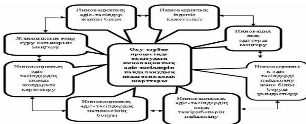
Сурет 1. Оқу-тәрбие процесінде оқытудың инновациялық әдіс – тәсілдерін пайдаланудың педагогикалық шарттарының өзара жүйелік бірлігінің моделі

Сондықтан инновациялық әдіс-тәсілдерді оқу процесіне енгізу барысы, белгілі деңгейде белсенділігін педагогикалық шарттарын төмендегі суреттен көруге болады: